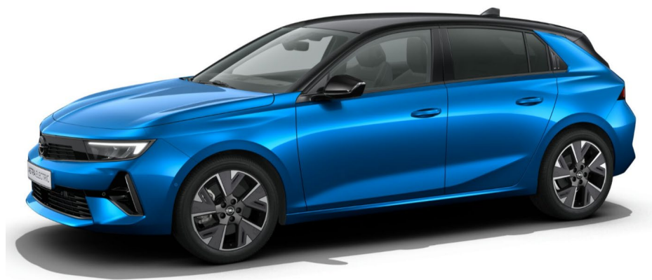
Business Launch Edition 18"