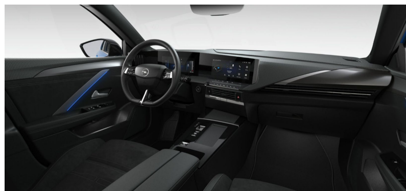
Business Launch Edition X7FX