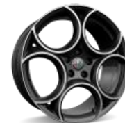
19“ lengvojo lydinio ratlankiai