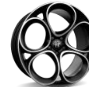
20“ lengvojo lydinio ratlankiai