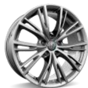
18“ lengvojo lydinio ratlankiai