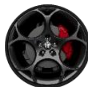
21“ lengvojo lydinio ratlankiai