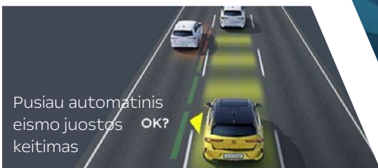
Pusiau automatinis eismo juostos keitimas OK?