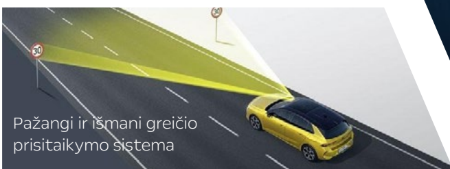
Pažangi ir išmani greičio prisitaikymo sistema