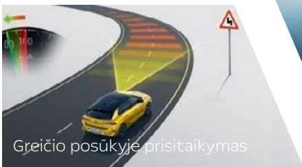
Greičio posūkyje prisitaikymas