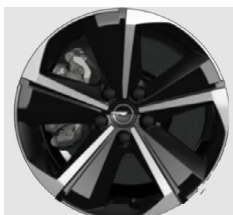
17" Innovation Plus